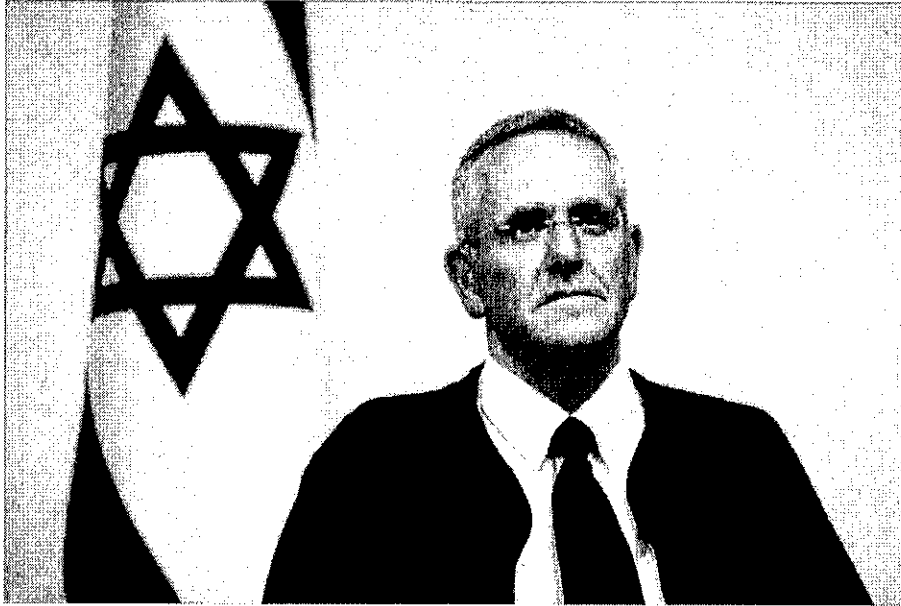
זיו מינץ

ישנה סיבה נוספת שבגינה טיעות הימין באופוזיציה אינן ממהרות לבג"ץ: בג"ץ לא נדיב כלפיהן. העתירה של ח"כ אמסלם הוא דוגמה טובה לכך: גנץ קידם מינוי פוליטי (עמיר פרץ) למנכ"ל התעשייה האווירית. אמסלם עתר לבג"ץ, והשופט מינץ דחה את העתירה בשל פרשנות שמרנית לזכות העמידה. תגובה אמסלם הייתה כעורה: "אם מינץ לא שתה ויסקי לפני שכתב את פסק הדין אל תקראו לי דודי. עאלק שופט, במבוא למשפטים לא היו מקבלים אותך". אבל לגופו של עניין, קשה להתעלם מהפגמים בפסק הדין של מינץ.