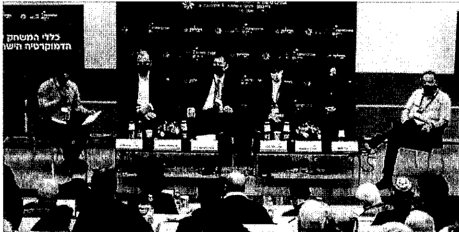
הכנס על יסוד החקיקה באוניברסיטת רייכמן.

נאח | יהודה יפרח | ז' בשבט ה'תשפ"ב (11:41 09/01/2022) בחן דעות