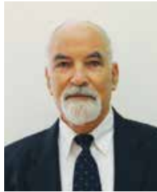
פרופ' שמעון שרביט רקטור המכללה