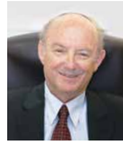
פרופ' שלמה גרוסמן נשיא המכללה