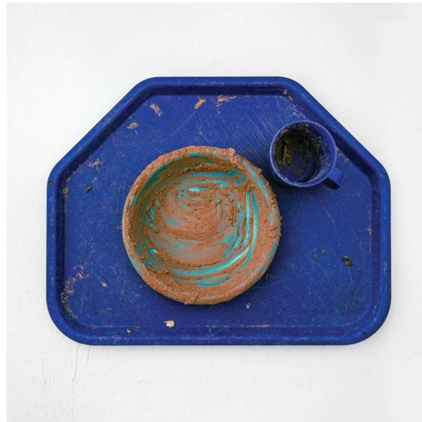
תמר אוסטרנהוף, ארכיון השתתפותי, חצר הגרוטאות, מגש אוכל: "גן סביון", קיבוץ ערערה / צלחת: "גן ורד", קיבוץ בית השיטה / כוס: "גן נירים", קיבוץ עברון, 2021, תצלום דיגיטלי, מידות משתנות תמר אוסטרנהוף, ארشیף תשארקי, ساحة الخردوات: صينية طعام: «حديقة سفيون», קייבوتס שאגר هعمكيم | صحن: «حديقة فيرد», קייבوتס בית השיתא \ كأس: «حديقة نيريم», קייבوتס עפרון, 2021, تصوير رقمي, مقاسات متغيرة