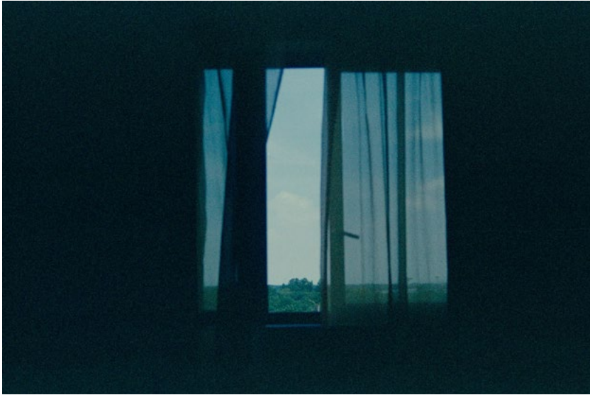
מאיה דיקשטיין, ללא כותרת , מתוך הסדרה 2014, Two Days and Two Nights in a Hotel Room תצלום 35 מ"מ, מידות משתנות מאיה דיקשטיין, בלא عنوان , من مسلسل 2014, Two Days and Two Nights in a Hotel Room تصوير 35 ملم، مقاسات متغيرة