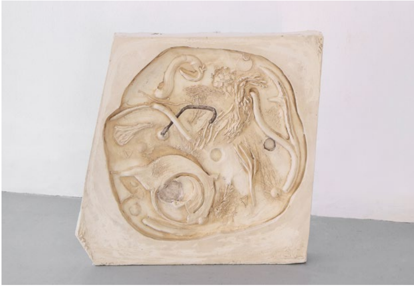
יעל מאירי, כשהירח מלא אפשר לראות, 2022, גבס, 38x39x5 ס"מ یاغیل منیری، عندما يكون القمر بدرًا يمكن أن نرى، 2022، 38x39x5 سم