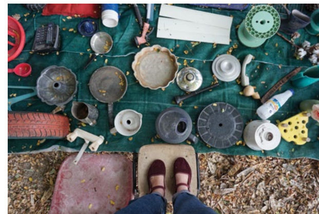
תמר אוסטרסהוף, העולם עדיין לא נרדם וגם אני עדיין ערה, 2021 תצלום דיגיטלי, תהליך עבודה, מידות משתנות תמר אוסטרסהוף, למ יגף העולם بعد وأنا، أيضًا، لا أزال يقظة، 2021 تصوير رقمي، سيرورة عمل، مقاسات متغيرة