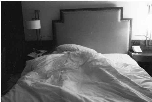
מאיה דיקשטיין, Two Days and Two Nights in a Hotel Room , 2014 עבודה מוקדמת, צילום אנלוגי 35 מ"מ, מידות משתנות מאיה דיקשטיין, Two Days and Two Nights in a Hotel Room , 2014 عمل مبكر، تصوير تناظري 35 ملم، مقاسات متغيرة