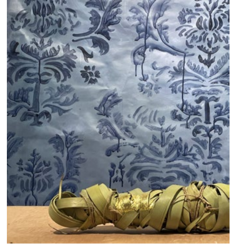
מאיה שמעוני, ללא כותרת, 2022, תהליך עבודה, עלי זהב על כף דקל, אקריליק על נייר, ממדים משתנים (צילום: מאיה שמעוני) מאיה שמעוני, بلا عنوان, 2022, أوراق من ذهب على صفائح نخيل، أكريليك على ورق، أبعاد متغيرة (تصوير: مايا شمعوני)