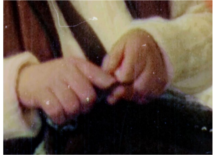
מאיה דיקשטיין, מתוך: ללא כותרת (ידיים וחוט, מקסיקו סיטי) , 2015 וידאו (המרת סרט סופר 8 מ"מ), 1:30 דק' מאיה דיקשטיין, بدون عنوان (اليدن والخيظ، ماكسيكو سيتي) , 2015 فيلم (تحويل فيلم سوبر 8 مم)، 1:30 دقيقة