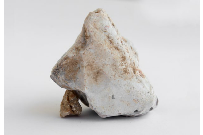
יעל מאירי, מבנים באיזון, 2020, הדפסת פיגמנט ארכיבי, 40x60 ס"מ یاغیل منیری، أحجار في توازن، 2020، طباعة خضاب أرشيفي، 40x60 سم