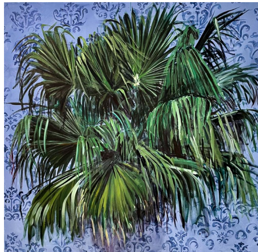
מאיה שמעוני, Palm Court Palm , 2022 אקריליק על בד, 150x150 ס"מ מאיה שמעוני, Palm Court Palm , 2022 אקריליק על قماش، 150x150 سم