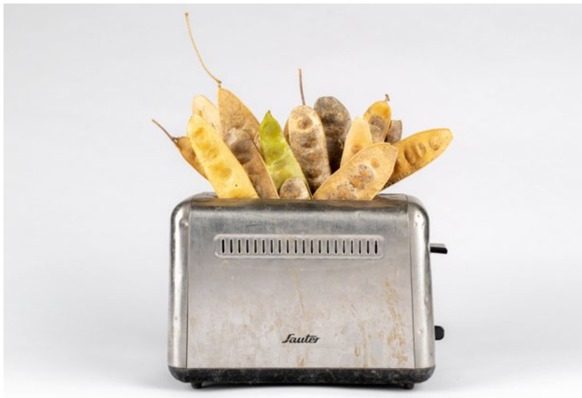
תמר אוסטרנהוף, ארכיון השתתפותי, חצר הגרוטאות, טוסטר: "גן ניצנים", קיבוץ רמות מנשה, 2021, תצלום דיגיטלי, מידות משתנות תמר אוסטרנהוף, ארشیף תשארקי, ساحة الخردوات, توستر: «حديقة نيتسانيم», קייבوتס רמות מנשה, 2021, تصوير رقمي, مقاسات متغيرة