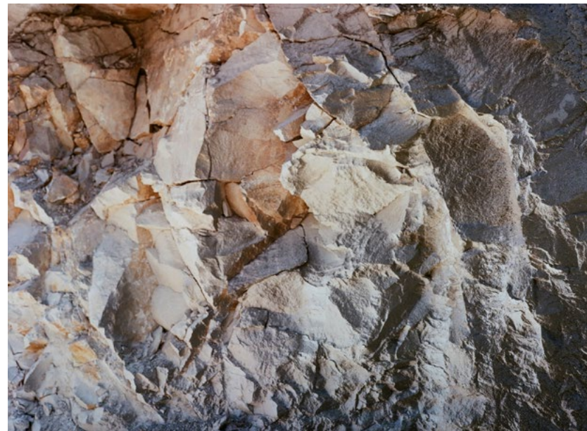
יעל מאירי, חצוב , 2020 הדפסת פיגמנט ארכיבי, 10x15 ס"מ יאעיל מئירי, محفور , 2020 طباعة خضاب أرشيقي، 10x15 سم