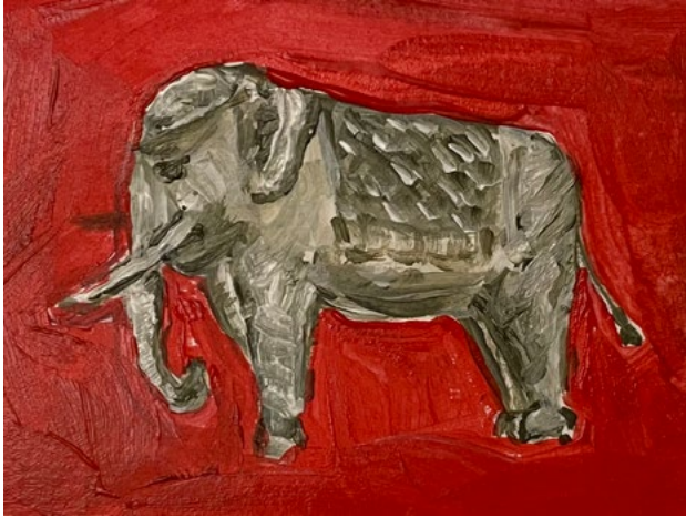
מאיה שמעוני, שיבושים בשרשרת האספקה (תאילנד), 2022 רישום הכנה, אקריליק על נייר, 10x7 ס"מ (צילום: מאיה שמעוני) מאיה שמעוני, اضطرابات في سلسلة التوريد (תאילנד), 2022, تسجيل إعداد, أكريليك على ورق، 10x7 سم (تصوير: مايا شمعوני)