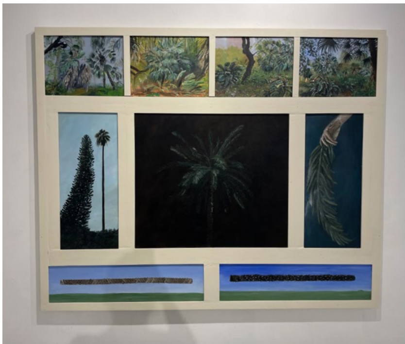
מאיה שמעוני, אקזוטיקה דומסטית , 2022 פוליפטיוך, אקריליק על בד, מסגרת עץ וצבע, 150x170 ס"מ מאיה שמעוני, اغتراب روحي داخلي - محلي , 2022, פוליפטיוך, אקריליק על قماش, إطار خشب ولون، 150x170 سم