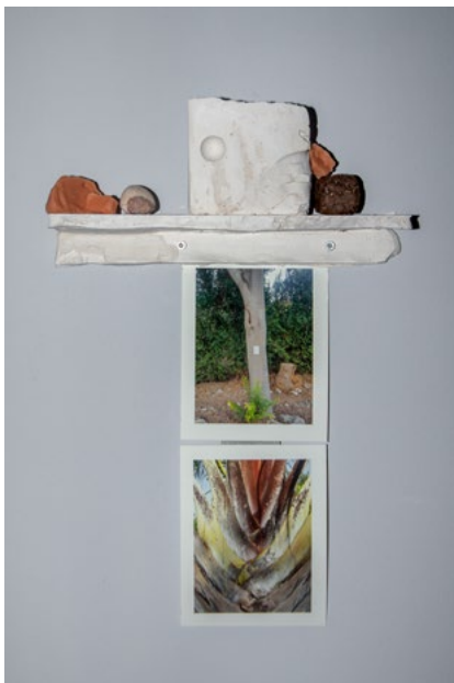
יעל מאירי, צלב (בסטודיו) , 2022 תהליך עבודה, גבס, סיליקון ואדמה מיובאת, הדפסת פיגמנט ארכיבי, 30x45x5 ס"מ יאעיל מנירי, סליב (פי האסטודיו) , 2022 סרורה עמל, גיס, טבאעא חצאב ארשיפטי, סיליקון וטראב מסטורד, 30x45x5 סמ