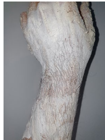
יעל מאירי, מתקשה (בסטודיו) , 2022 תהליך עבודה, הדפסת פיגמנט ארכיבי, מידות משתנות יאעיל מנירי, אקסו (פי האסטודיו) , 2022 סרורה עמל, טבאעא חצאב ארשיפטי, מואסאט מתעטרה