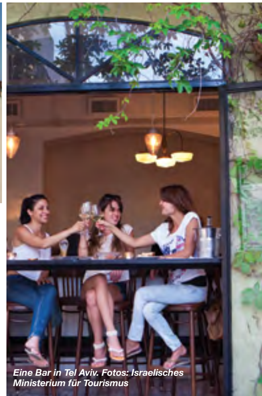
Eine Bar in Tel Aviv.

Jenseits der Altstadtmauern sollten Sie sich den Machane Yehuda Markt nicht entgehen